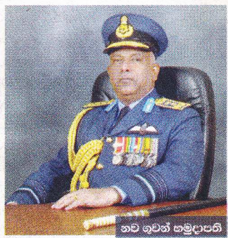
64 වන හමුදාපති

සුරකිලි ලකුණු තේමා පාඨය කර ගනිමින් ශ්‍රී ලාංකීය ලක් අඹර සුරකින ශ්‍රී ලංකා ගුවන් හමුදාවේ 64 වන සංවත්සරය 2015 මාර්තු 02 වන දින අභිමානවත් ලෙස සමරයි. 64 වසරක අභිමානවත් ගමන් මග තුළ සිදුවූ වැදගත් සිද්ධීන් ගුවන් හමුදාවට මෙන්ම සමස්ත ශ්‍රී ලංකාවටම ඉතාමත්ම වැදගත් වූ බව පෙනී යයි.